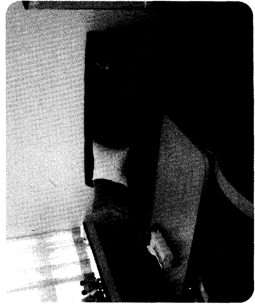
「一日に7人に出会うと幸せが訪れる」と言われています