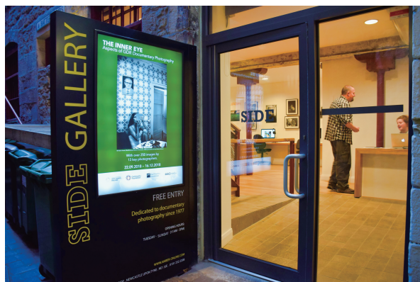
図2 Side Galleryの入口 (2018年10月)