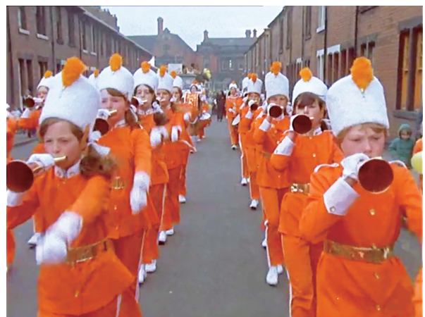
図6 「Wallsend 72」(1972年/11分)

ただし、青少年といってもそのほとんどは8歳から18歳までの少女たちだった。それは、ディクソンの言葉を借りれば「(メンバーの)ほとんどが女性や少女たちであるにも関わらず、男性によってある種の軍隊的な方法で監督されるという奇妙なもの」であった。ディクソン自身は、このジャズバンドと