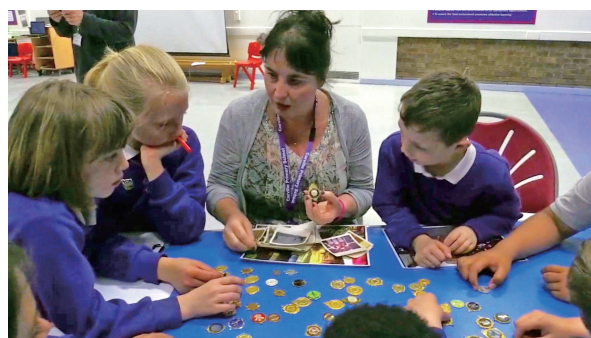
図7 質問をする子どもたち