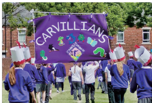
図8 マーチングする「Carvillians」