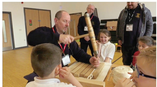
図 11 サンダーランド海洋遺産センターによる実演