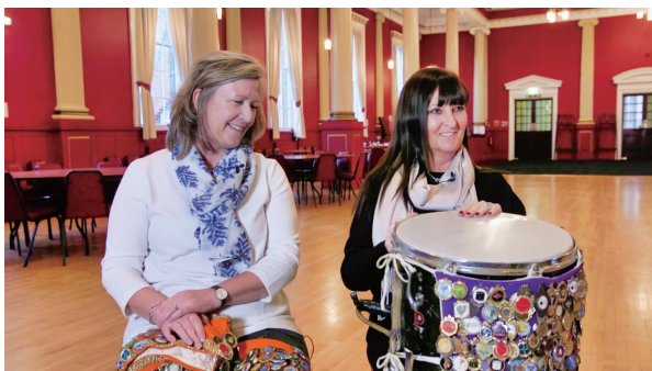
図9 「We are the Legionnaires」(2015年/© Amber Films/25分)

カービル小学校プロジェクトは、このように小学校でのプログラムを超えた広がりを持っていた。子どもたちにとっては地域の歴史を学び、それを現在につなげる総合的な実践プログラムであったと同時に、かつてのジャズバンドメンバーにとっては過去を意識的にふり返り、共有することが仲間内を超えて地域コミュニティにとっても大きな意味を持つ、そのことに気づく契機となったプロジェクトであった。