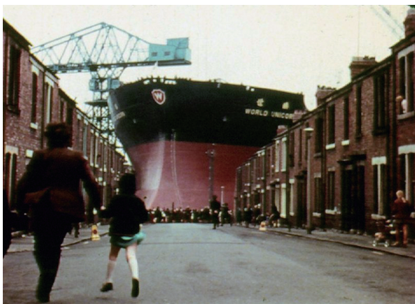
図3 「LAUNCH」(1974年/© Amber Films/10分)