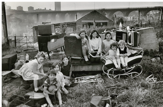
図4 「Kids with Collected Junk Near Byker Bridge (Byker)」(1971年)

community)」と呼び、その見学ツアーを開催していたことである。ツアーが実施された「産業コミュニティ」は1980年代にかけて拡大し、漁業・炭鉱業・鉄鋼業・造船業などが含まれていたという。