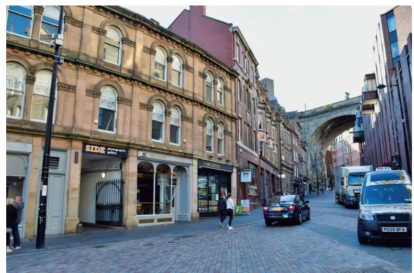
図1 Side Gallery への入口がある Side Street (2018年10月，筆者撮影)

また一方で，制作プロセスで得られた地域での関係性を活かし，制作に留まらない活動も1970年代から展開している。それは，撮影対象であった各産業のコミュニティを「産業コミュニティ (industrial