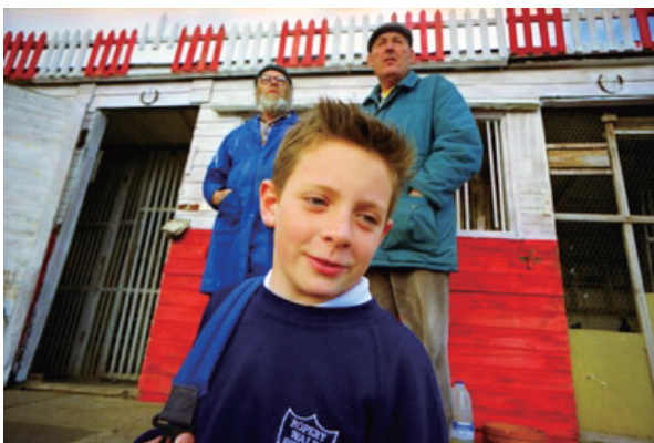
図5 「LIKE FATHER」(2001年/© Amber Films/95分)

2011年、Amberは本格的に作品コレクションのデジタル化に取り組み始めている。Amberの財源の多くは、チャリティ財団やアーツカウンシルなど