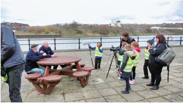
図13 インタビュー撮影をする子どもたち

インタビュイーを依頼するにあたり、予め彼らにさまざまな説明をしたり、お願いをしたのかという筆者の質問にディクソンの返答はシンプルだった。「(インタビュイーを依頼する相手が) 誰であっても、そこで私が念を押すのは、彼ら彼女らが話すことが重要だということだけです。」おそらくこれは、多くを説明する必要のない関係性がその時点までに既に構築されていることを表している。