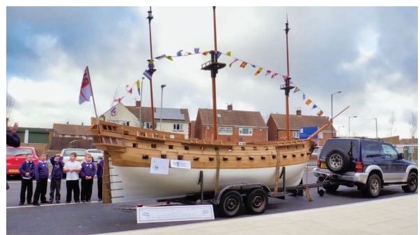
図 12 屋外に登場した巨大な船の模型