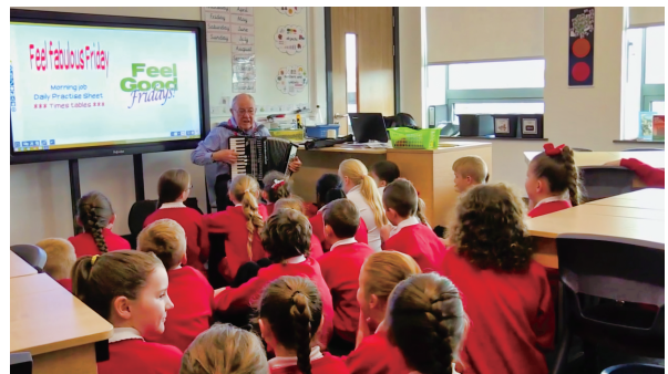
図 10 弾き語りを披露するジョニー・ハンドル